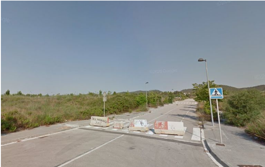
Urbanisme abandonat.