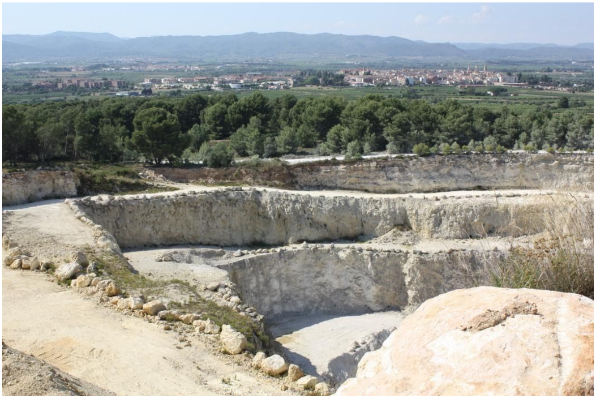
Pedrera activa amb permís per l'ampliació de la zona extractiva.

Si en canvi ens centrem als espais naturals, caram, amb aquest decàleg de ben segur que hi haurà un impuls a la preservació, potenciació i fins i tot una oportunitat de creació d'oferta turística de qualitat. Doncs un cop més, no. De fet s'ha aprovat l'ampliació de la quadrícula minera en favor de les extractores de carbonat càlcic per ampliar les zones de voladures de les empreses Reverté i OMYA, a tocar del parc natural del Foix, al Garraf, cosa que no només afecta la qualitat de vida dels veïns de les poblacions properes, sinó que irremediament afecta l'entorn natural del propi parc, pertorbant l'ecosistema. Aquí tenim el model territorial, sostenible i resilient al canvi climàtic que ens proposen. Per molt que