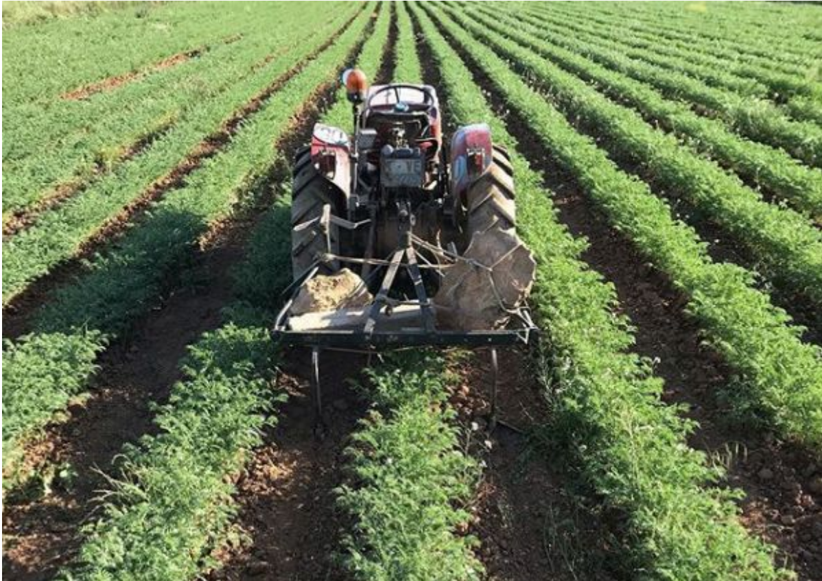
Activitat agrària penedesenca.

Participem a fer la vegueria que volem i no deixem que ens diguin què hem de ser.