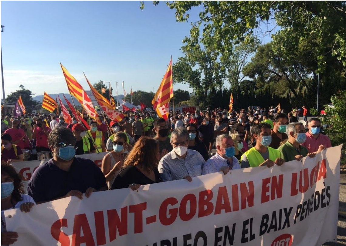
Vaga pel tancament de la cristallera. Polítics a primera línia, afectats al darrere.